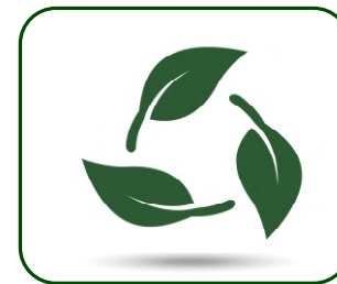
Formulé sans synergiste (PBO) de synthèse