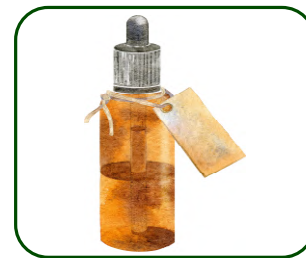
Huiles essentielles végétales