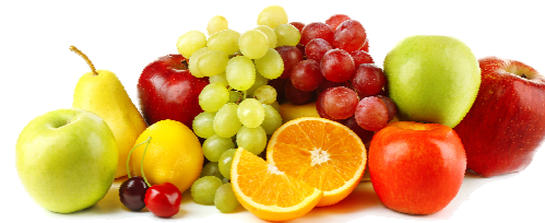
Arbres Fruitiers - Vignes

Sulfate de Cuivre 200g/kg - Non Colorée - Ne Tache Pas